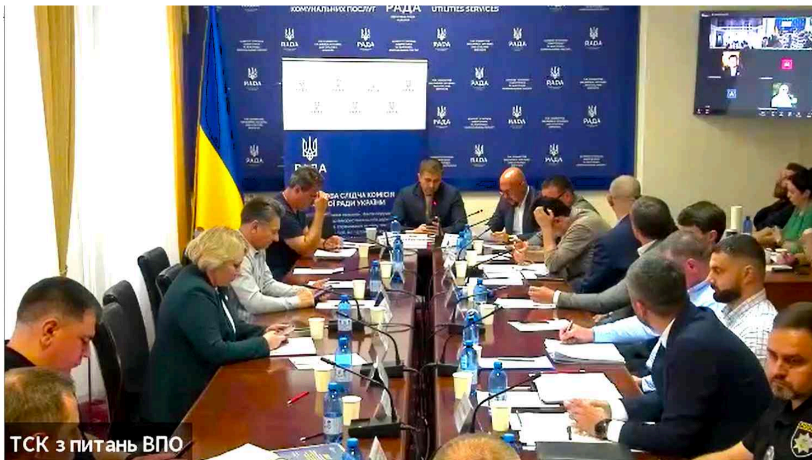
ТСК з питань ВПО