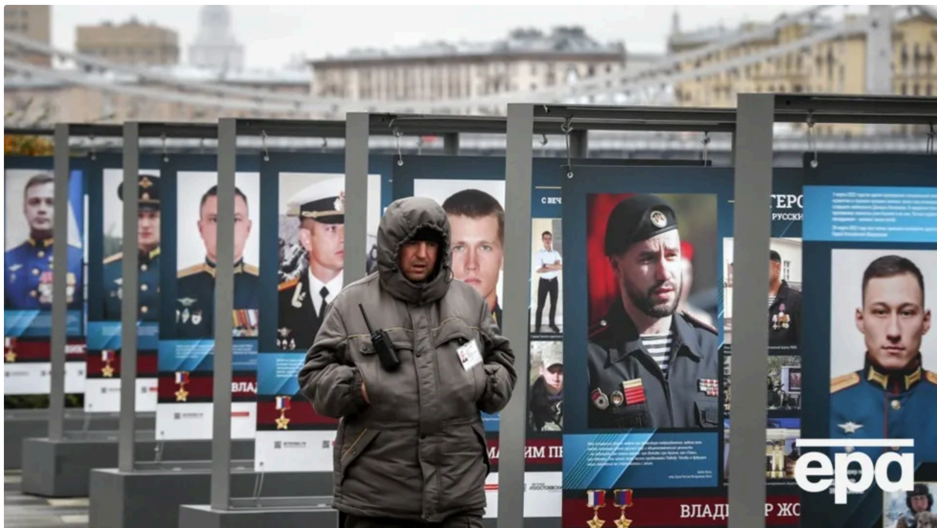
Розслідувачі підтвердили імена загиблих на фронті в Україні окупантів.

Журналісти BBC, "Медіазони" та волонтери підтвердили імена понад 226 тис. загиблих російських військових у війні проти України. Про це йдеться у розслідуванні, яке російська служба BBC оприлюднила 12 червня.