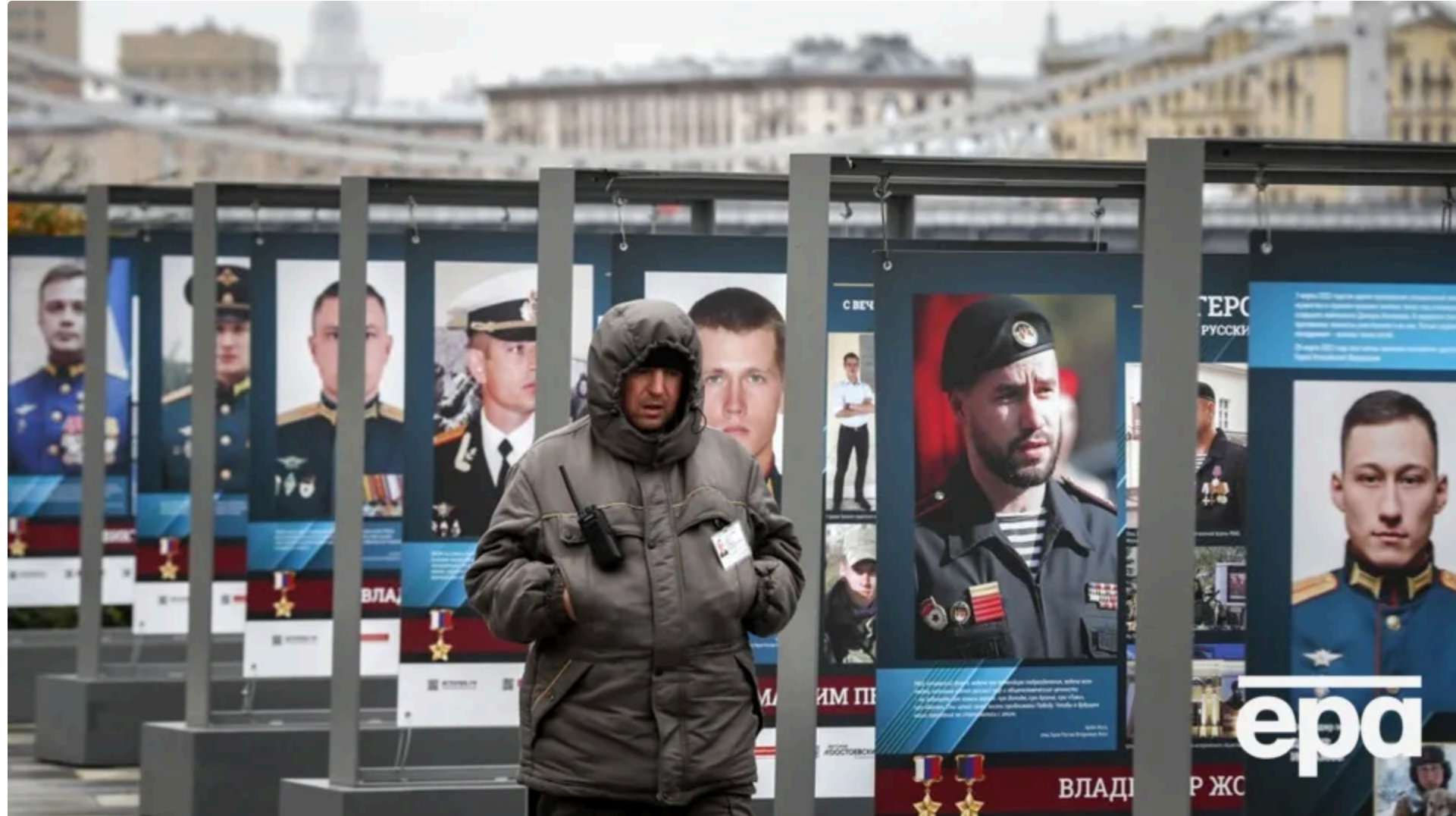
Розслідувачі підтвердили імена загиблих на фронті в Україні окупантів

12 червня, 15.02 🗣️ Этот материал также можно прочитать на русском