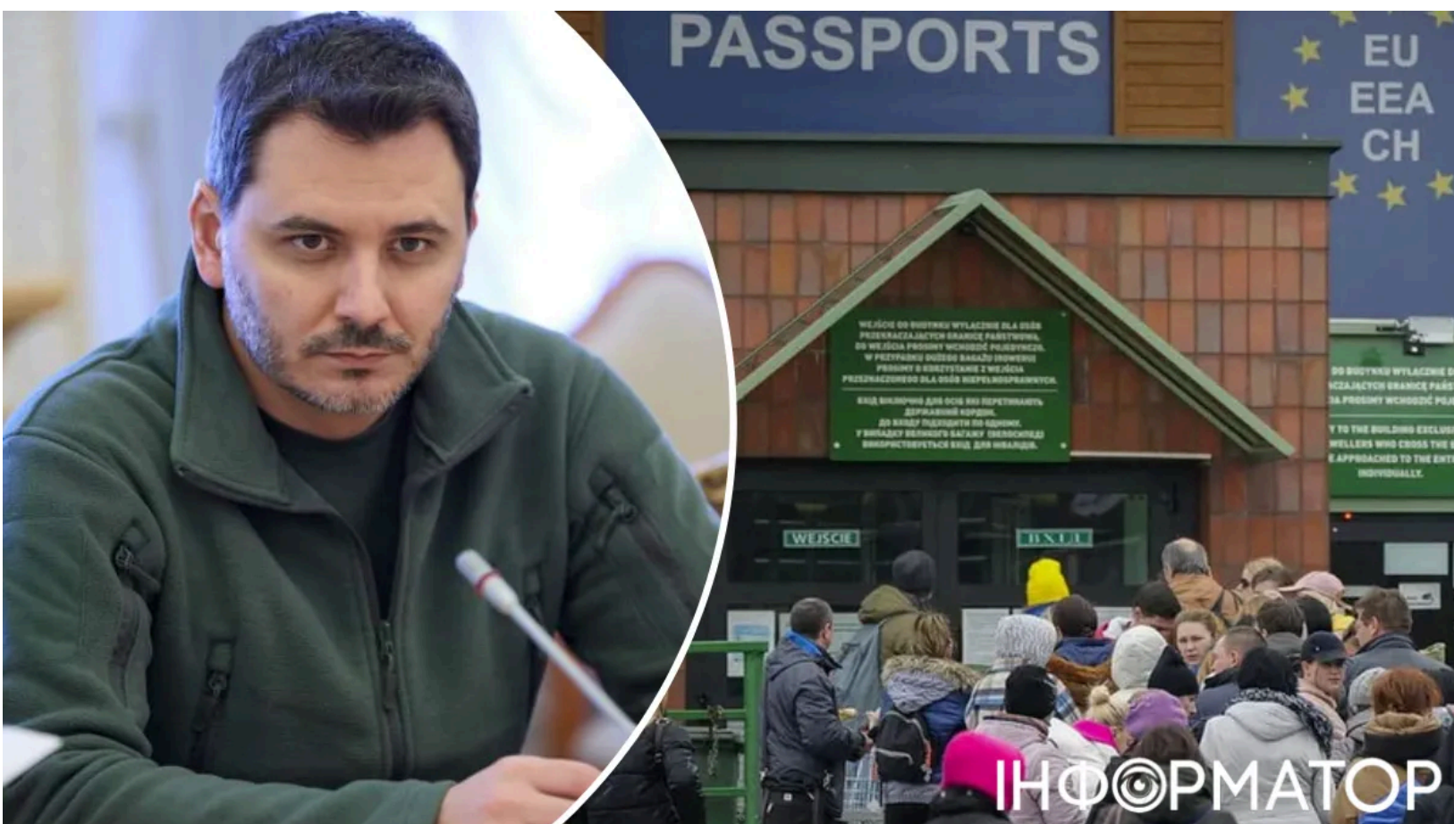
Чернів пояснив межі виселення українців з ЄС.

Жодна країна Євросоюзу не може виселити українського чоловіка лише через його призовний вік - це суперечить міжнародному праву. Схожий висновок минулого тижня озвучило й МЗС у заяві про біженців . Натомість держави можуть позбавити цю категорію чоловіків соціальних виплат або пільг. Але чи змусить це їх повертатись - велике питання.