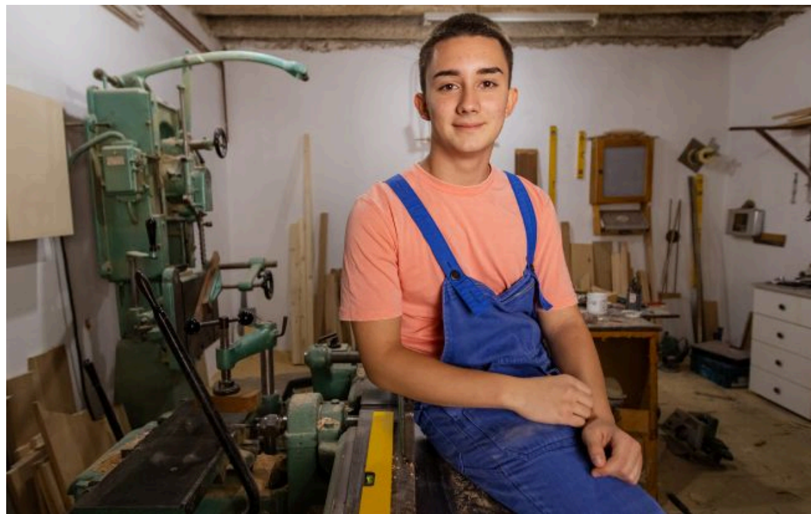
Фото: У МОН назвали найбільш перспективні професії у 2026 році

Не витрачай час на шум! Читай тільки суть з РБК-Україна у Google