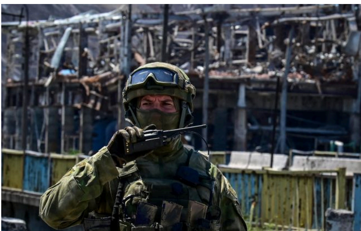
Фото: росіяни почали більше застосовувати авіацію через проблеми з логістикою