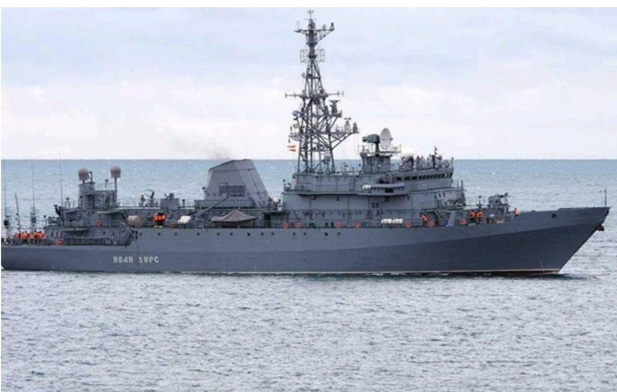
Фото: Соцмережі (ілюстраційне фото) Російський корабель Іван Хурс

Розвідувальний корабель Чорноморського флоту Росії Іван Хурс фактично зруйновано після останньої атаки.