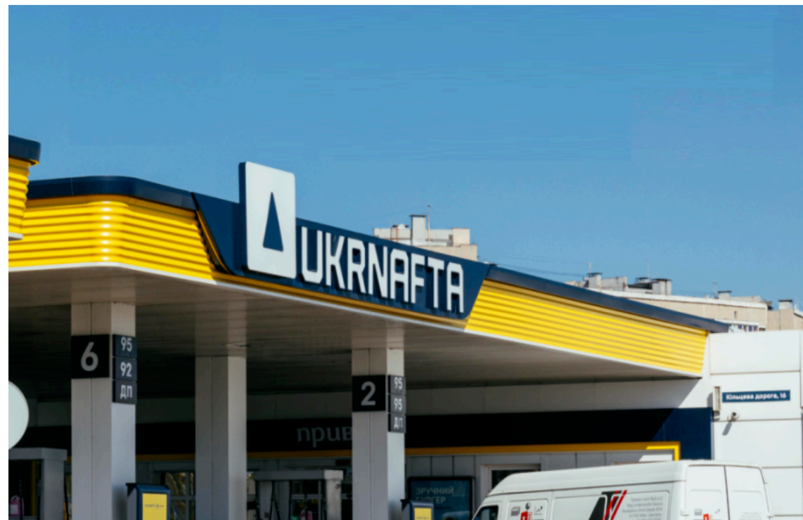
"Укрнафта" збільшила продажі пального на колишніх заправках Shell на 118%

Автозаправні комплекси "Альянс Холдинг", які раніше працювали під брендом Shell, а сьогодні є частиною найбільшої мережі АЗК України UKRNAFTA, продовжують демонструвати впевнене зростання показників.