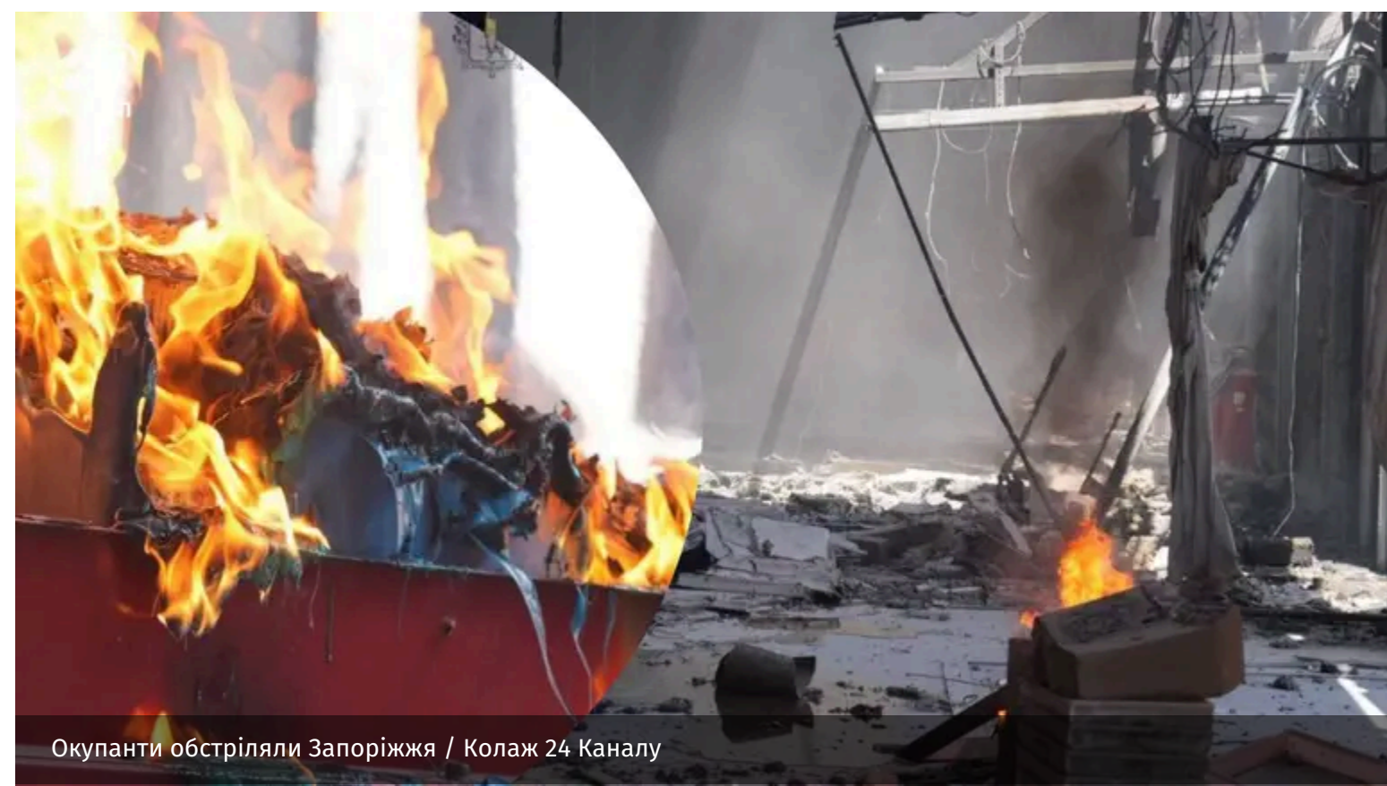
Окупанти обстріляли Запоріжжя

Вранці Запоріжжя опинилося під масованими ударами дронів. У місті є руйнування, виникли пожежі.