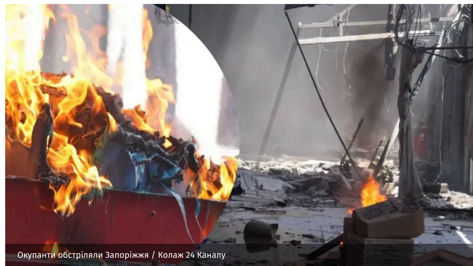
Окупанти обстріляли Запоріжжя

Вранці Запоріжжя опинилося під масованими ударами дронів. У місті є руйнування, виникли пожежі.