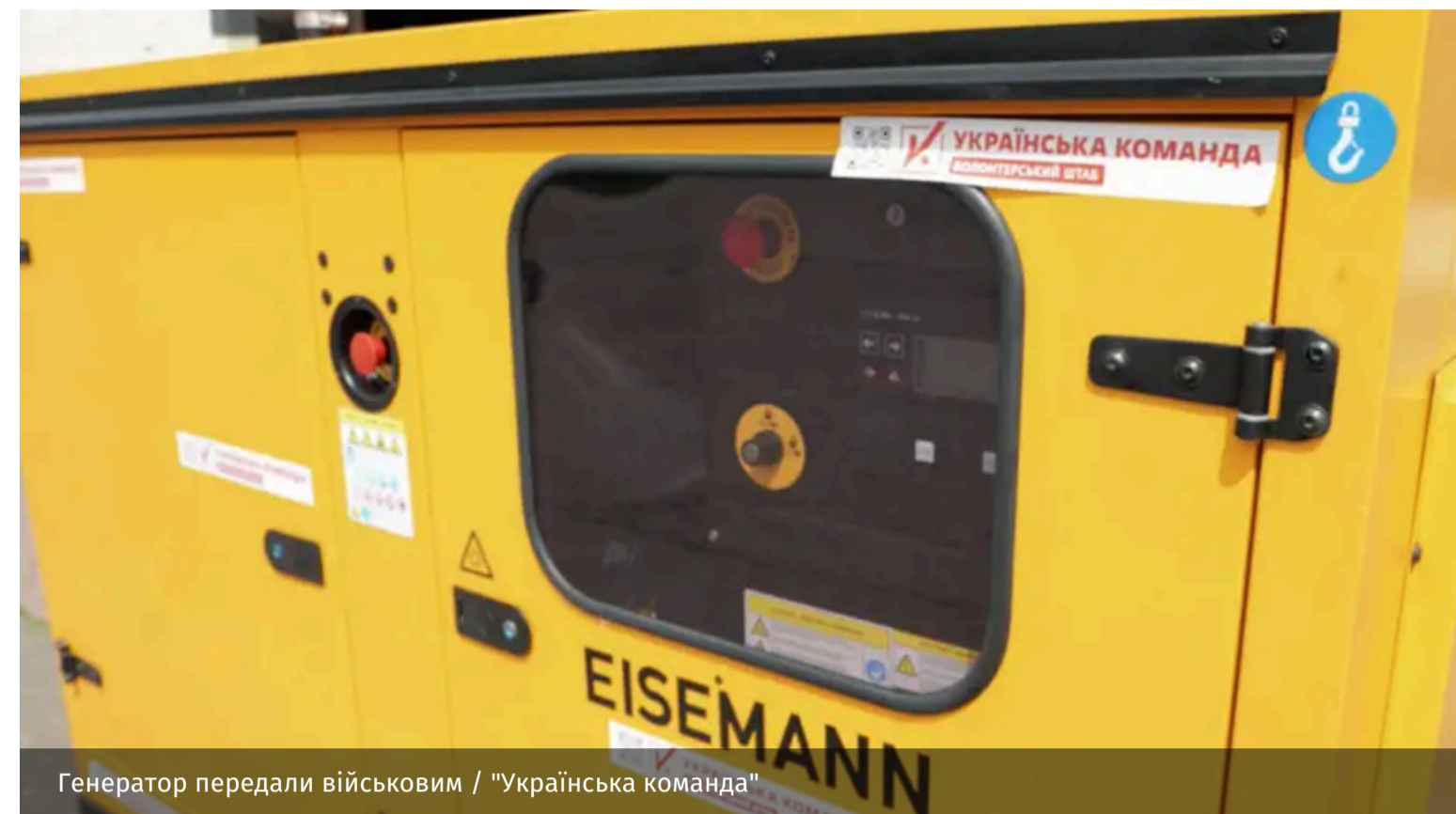
Генератор передали військовим

Волонтери "Української команди" передали батальйону "Свобода" потужний генератор. Завдяки ньому військові зможуть забезпечити безперебійне живлення великих військових об'єктів.