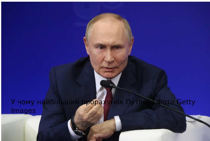
У чому найбільший прорахунок Путіна?

( viber://forward?text=https://24tv.ua/viy-na-rosiyeyu-chomu-naybilshe-pomiliv-sya-putin_n3086469 )