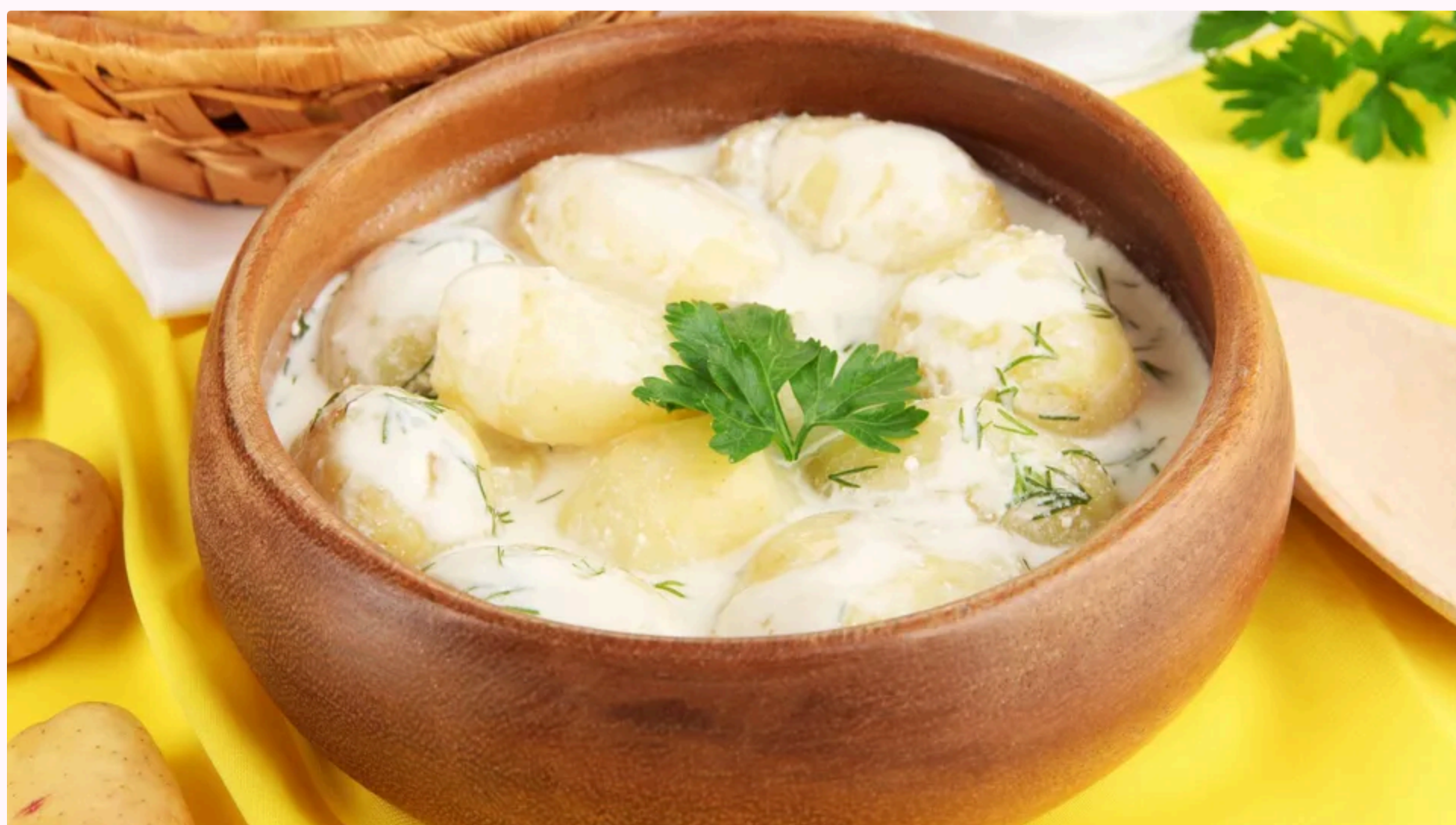
Картопля вийде надзвичайно апетитною

12 червня, 13.15 Цей матеріал також можна прочитати на руському