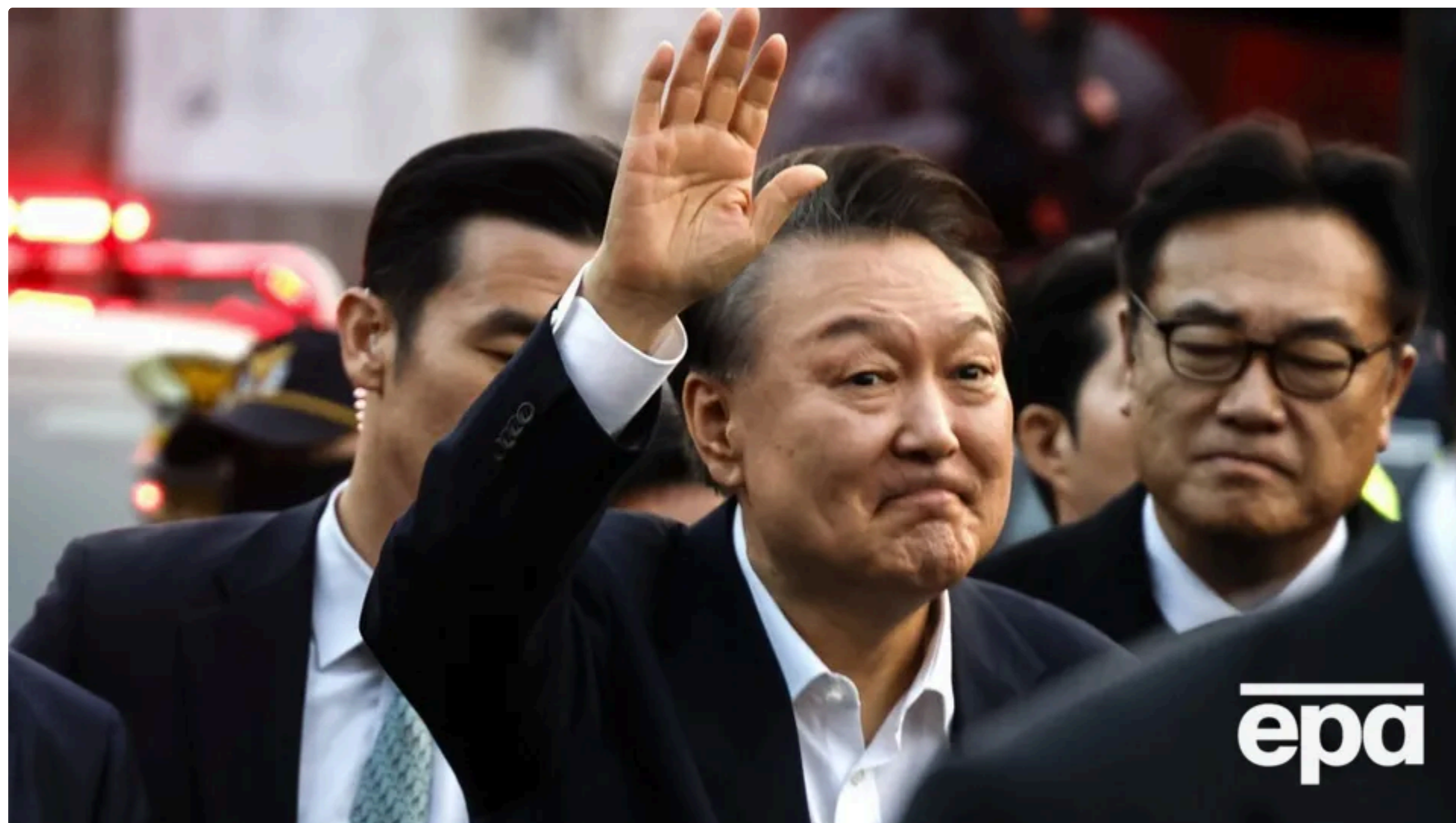
Це щонайменше третій вирок Юну в справах, пов'язаних зі спробою запровадити воєнний стан у країні

12 червня, 13.40 🗣️ Цей матеріал також можна прочитати на руском