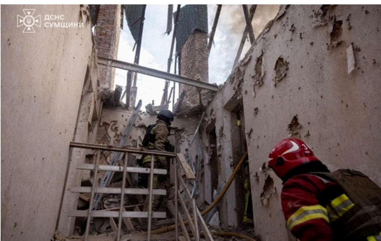
Фото: ДСНС. Наслідки російського обстрілу в Сумах

Вже втретє з початку року росіяни атакували Сумську громаду з далекобійного артилерійського озброєння.