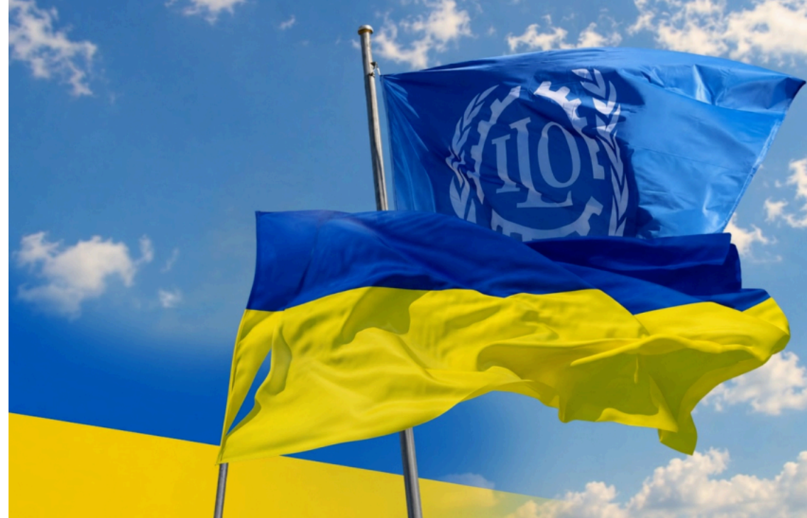
Україна та МОП підписали Програму гідної праці / Міністерство розвитку громад та територій України

Україна та Міжнародна організація праці (МОП) підписали Програму гідної праці на 2026–2029 роки, яка спрямована на створення продуктивної зайнятості, розвиток людського капіталу та підтримку бізнесу. На впровадження запланованих заходів потрібно мобілізувати близько $70 млн. Частину фінансування вже надали міжнародні партнери.