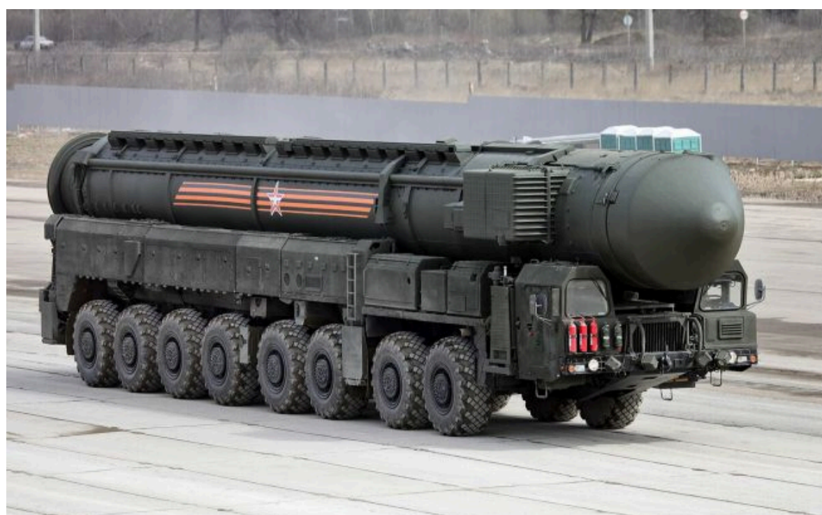
Фото: як Україна дізнається про пуски "Орешніка" (росЗМІ)