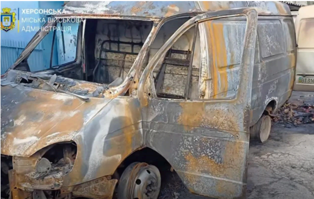
Наслідки чергового ворожого обстрілу

Внаслідок атаки спалахнула пожежа, котра знищила кілька магазинів, кіосків та мікроавтобус з продуктами.