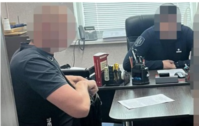
ДБР повідомило про підозру начальника РТЦК на Кіровоградщині

Підполковник не задекларував придбання автомобілів на понад 2,3 млн грн та не вказав дохід у 200 тис. грн, отриманий від продажу транспортного засобу.