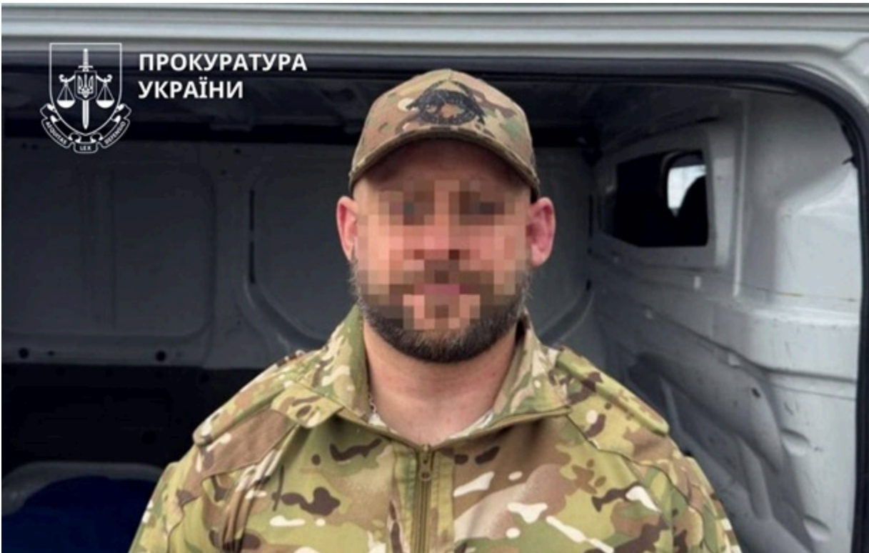
Обіцяв маршрут до Молдови за 20 тис. доларів: підозрюють військовослужбовця ЗСУ

За даними слідства, він організував незаконне переправлення військовослужбовця Нацгвардії через кордон поза пунктами пропуску, оцінивши "послугу" у 20 тис. доларів.