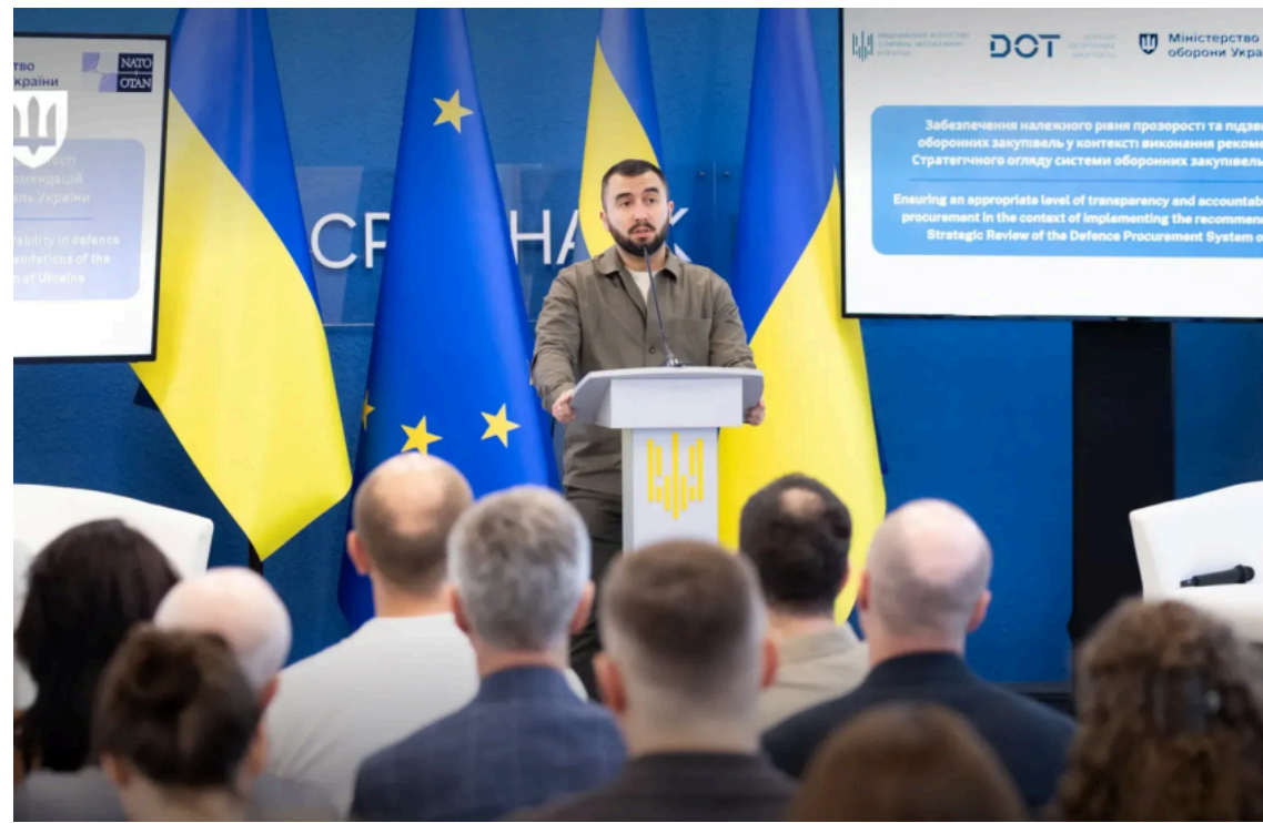
Міноборони переводить закупівлі на електронні тендери

Міністерство оборони поступово впроваджує конкурентні тендери в закупівлях для Сил оборони. Новий підхід має зробити оборонні закупівлі прозорішими, зменшити корупційні ризики та ефективніше використовувати бюджетні кошти.