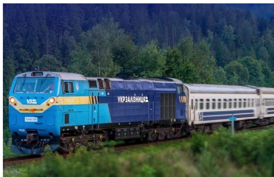
УЗ запускає додаткові рейси до гір на вихідні / Укрзалізниця

"Укрзалізниця" призначила два додаткові поїзди з Києва до популярних карпатських курортів на найближчі вихідні. Рішення ухвалили через стрімке зростання попиту на подорожі в гірському напрямку.