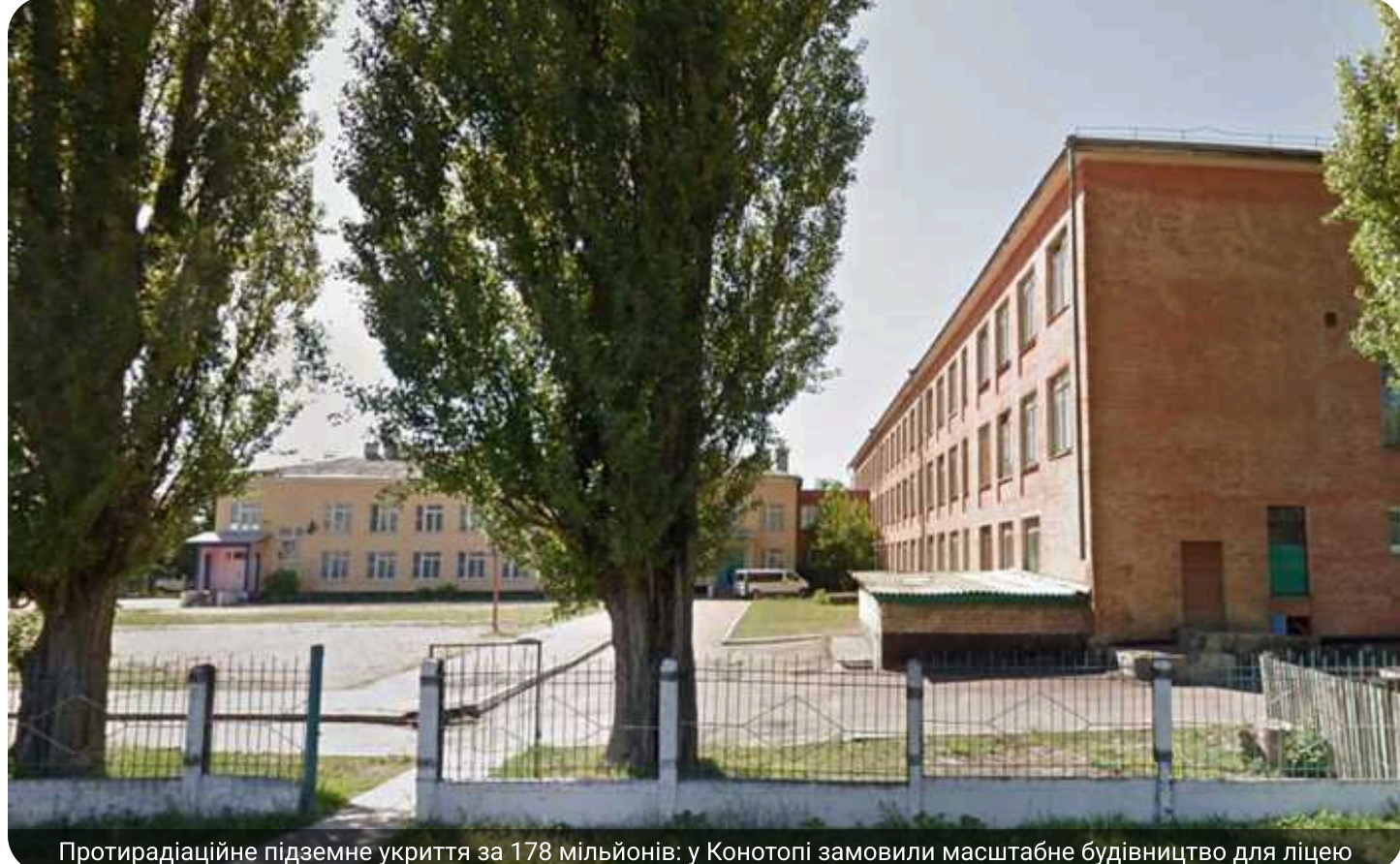
Протирадіаційне підземне укриття за 178 мільйонів: у Конотопі замовили масштабне будівництво для ліцею

Конотопський ліцей '9 Конотопської міської ради Сумської області 8 червня за результатами тендеру замовив ТОВ-фірма «Кортакоз» будівництво укриття за 178,11 млн грн. Про це повідомляється в системі «Прозорро». До кінця 2026 року мають збудувати підземне протирадіаційне укриття на 530 осіб з навчальними класами, мед кабинетом, буфетом із зоною прийому їжі, санвузлами та технічними приміщеннями. Проект торік виконало ТОВ «Крокус Інжиніринг», а експертизу – ТОВ «УК Експертиза». Будівництво проведуть на умовах співфінансування, де 160,29 млн грн – кошти держзубвенції в рамках Ukraine Facility, а 17,81 млн грн – місцевий бюджет. Договірна ціна тверда і включає 9,61 млн грн на покриття інфляційних ризиків (тут / далі ціни та суми з ПДВ). У підсумкову відомість ресурсів гарячекатану арматурну сталь періодичного профілю класу А-III діаметром 12 мм вписали по 59 747 грн/т .