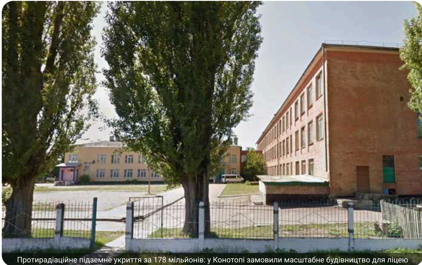
Протирадіаційне підземне укриття за 178 мільйонів: у Конотопі замовили масштабне будівництво для ліцею

Конотопський ліцей "9 Конотопської міської ради Сумської області 8 червня за результатами тендеру замовив ТОВ-фірма «Кортакоз» будівництво укриття за 178,11 млн грн.