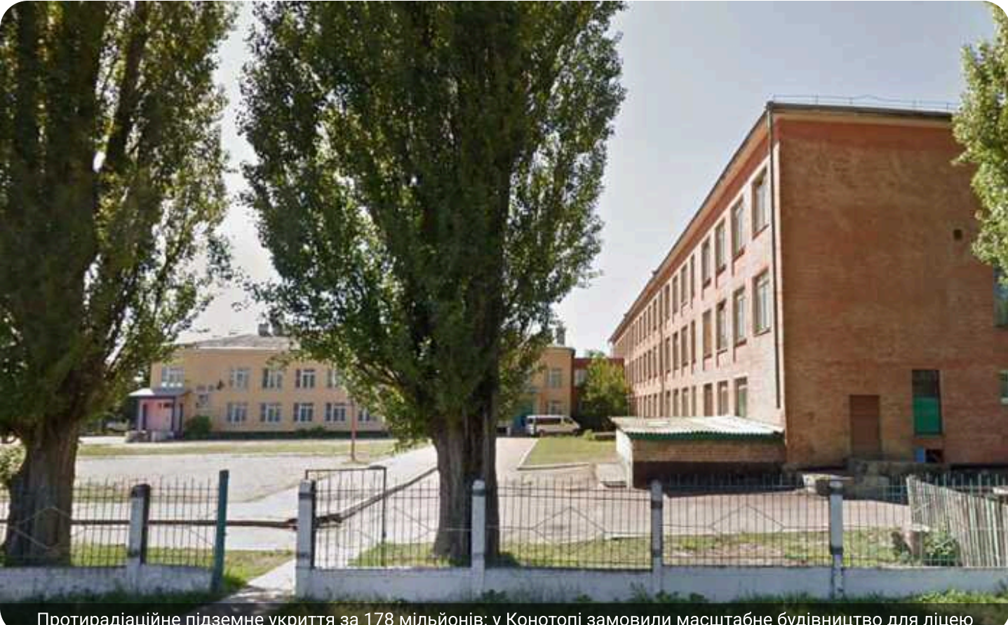
Протирадіаційне підземне укриття за 178 мільйонів: у Конотопі замовили масштабне будівництво для ліцею

Конотопський ліцей 19 Конотопської міської ради Сумської області 8 червня за результатами тендеру замовив ТОВ-фірма «Кортакоз» будівництво укриття за 178,11 млн грн.