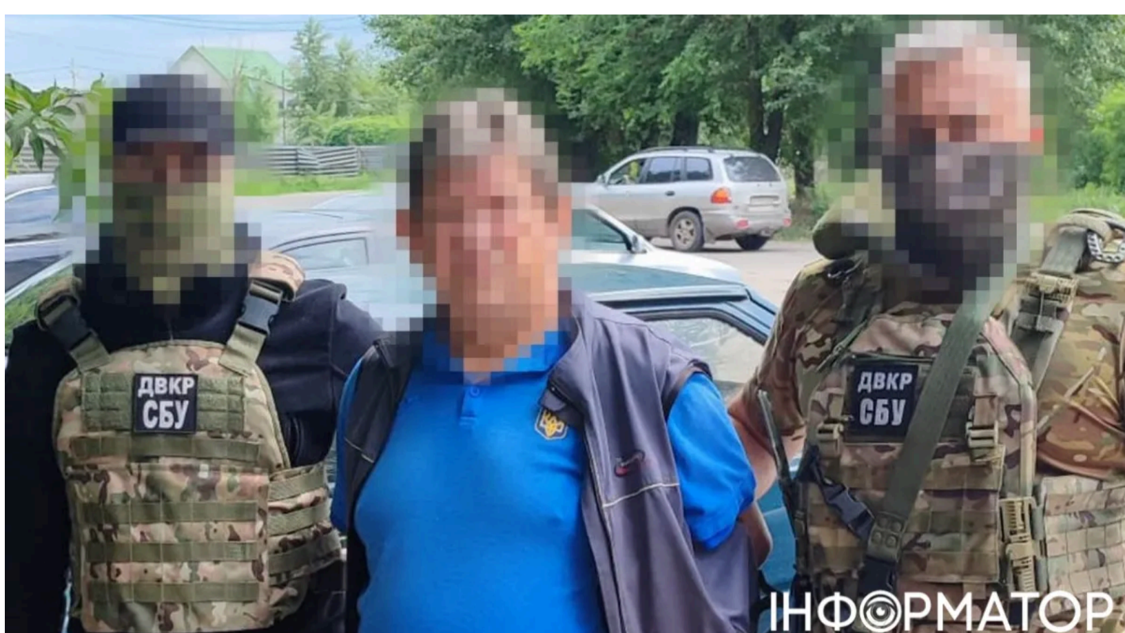
Реабілітолог із Придніпров'я шпигував для ворожої спецслужби.

Тренер-реабілітолог дітей з інвалідністю виявився агентом ФСБ : він передавав ворогу координати об'єктів протиповітряної оборони у трьох регіонах України. Підозрюваного викрила та затримала військова контррозвідка Служби безпеки України. Чоловіку загрожує довічне позбавлення волі.