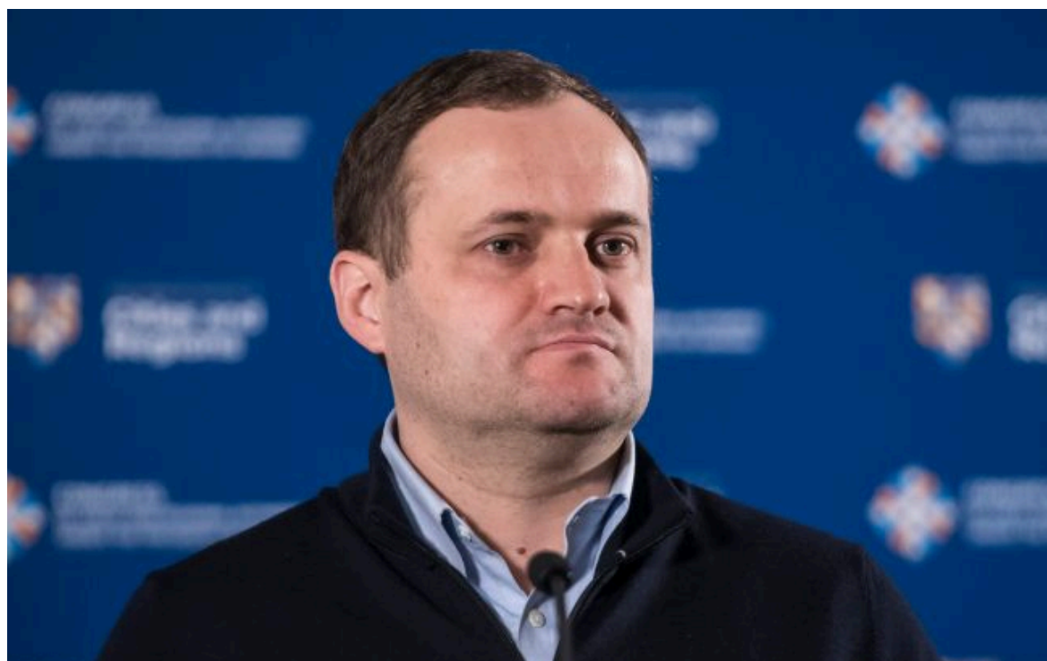
Фото: віцепрем'єр з відновлення - міністр розвитку громад та територій України Олексій Кулеба