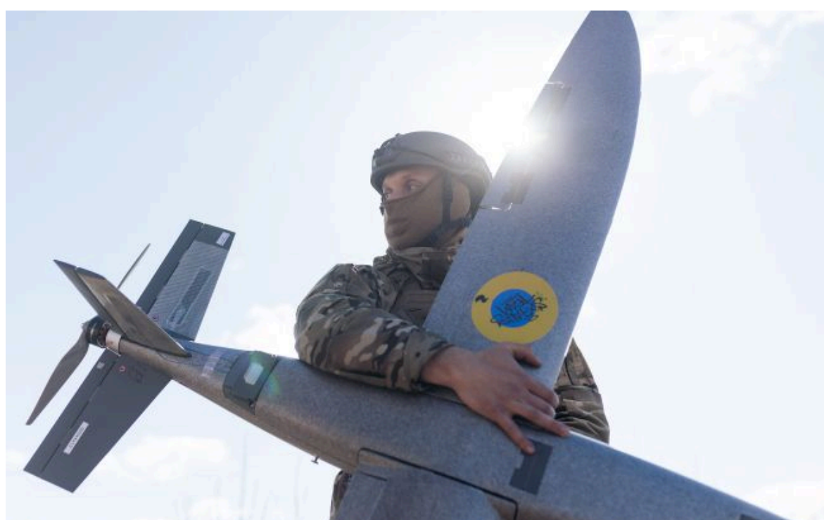
Фото: українські дрони уразили два НПЗ у Татарстані та комбінат у Тольятті