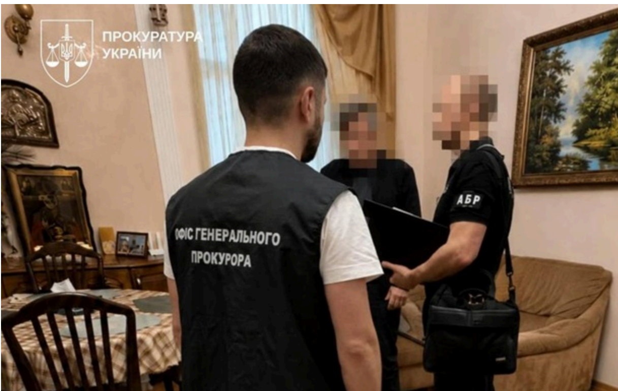
Повідомлено про підозру двом львівським бізнесменам та колишньому посадовцю Міноборони

Експосадовець Міноборони використовував вплив, щоб сприяти львівським підприємцям під час укладення контрактів із міністерством, і отримував за це неправомірну вигоду.