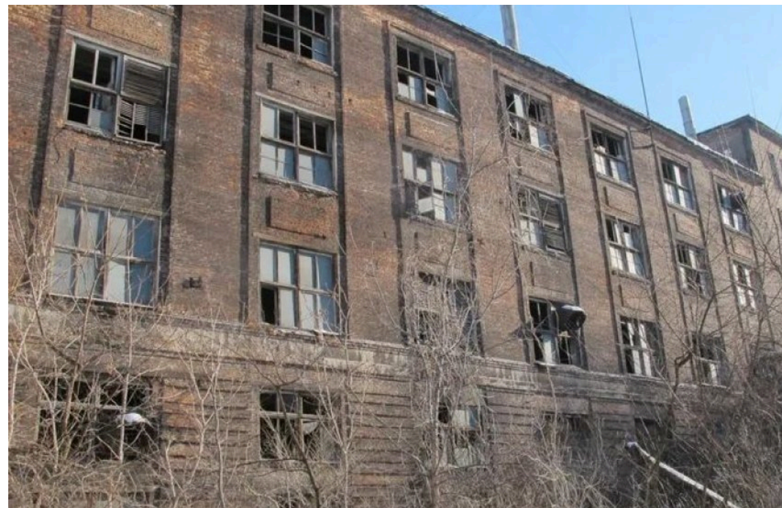
Завод мінеральних добрив у Кам'янському продали "Прозорро.Продажі"

ТОВ "Укравіт Сайенс Парк" стало переможцем аукціону з продажу майна збанкрутілого Дніпровського заводу мінеральних добрив. Фінальна вартість активу виявилася на 60% менше за початкову ціну, з якої стартував розпродаж майна підприємства.