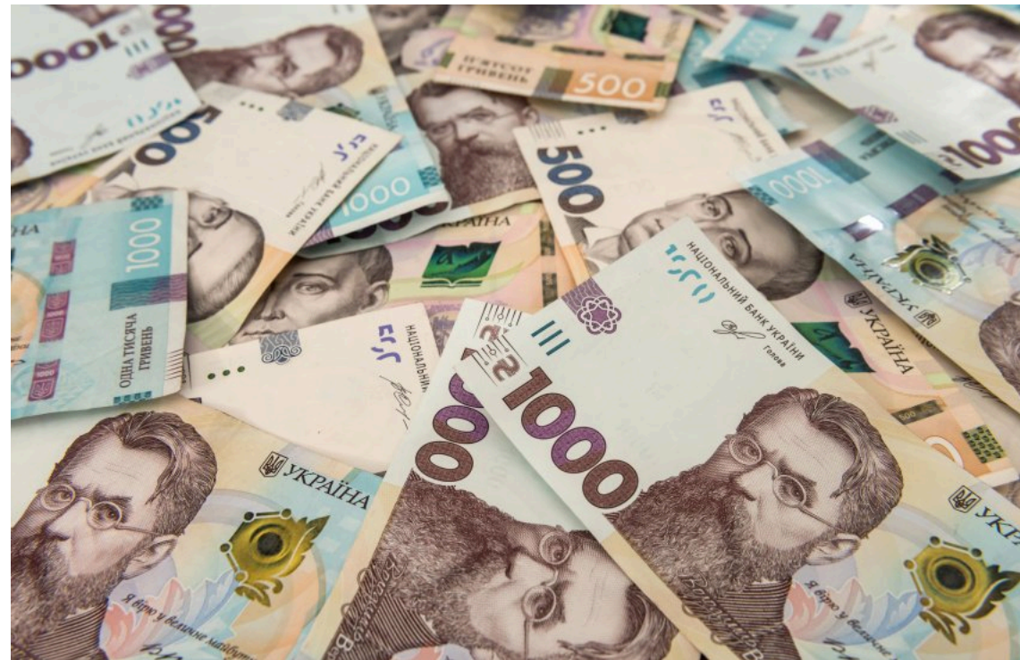
Держава спрямує 67,8 млрд грн на стійкість регіонів

Держава спрямує 67,8 млрд грн на реалізацію Планів стійкості регіонів завдяки змінам до державного бюджету, які підтримала Верховна Рада. Ще 9,6 млрд грн на ці потреби забезпечили місцеві бюджети.