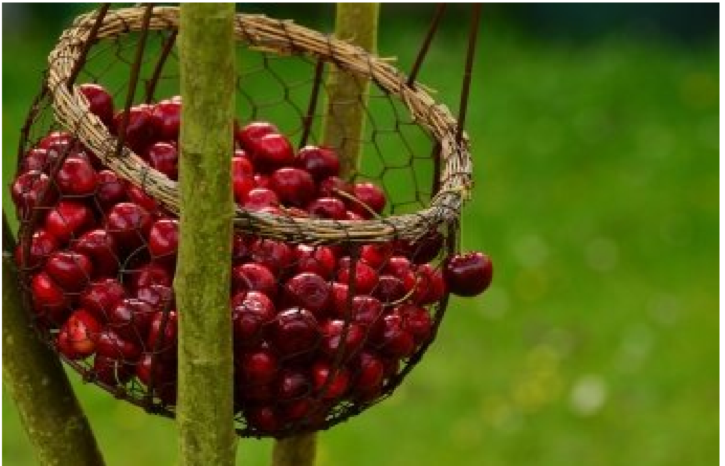
📷 Черешня в Україні дешевшає

В Україні почали активно знижуватися ціни на черешню з місцевих господарств. Зараз українська ягода надходить у продаж по 70–150 грн/кг, що в середньому на 23% дешевше, ніж наприкінці минулого тижня.