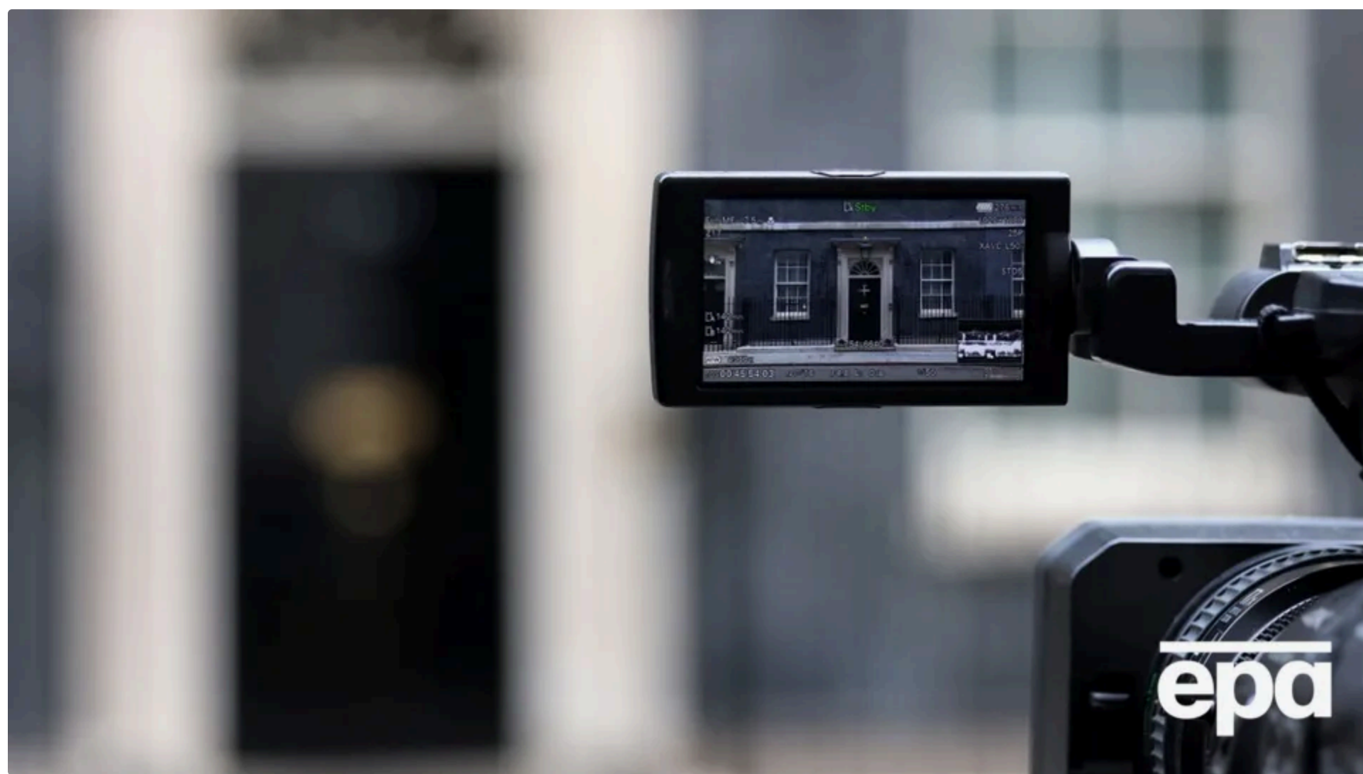
Замість Гілі призначили нового міністра оборони Фото: ERA (ілюстративне)

12 червня, 11:07 📧 Зтот материал также можно прочитать на русском