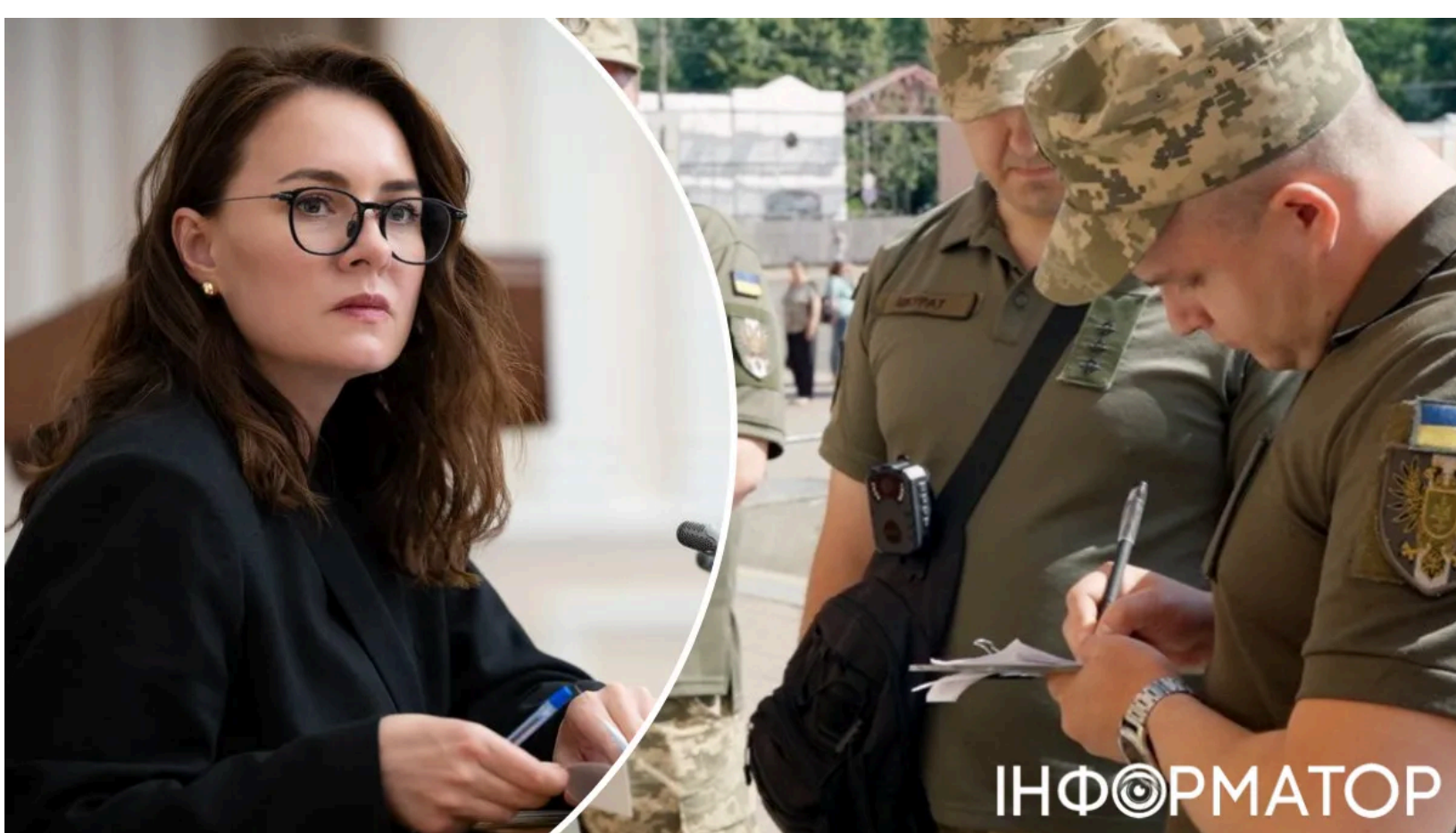
Реформа ТЦК - в останню чергу, каже Свириденко.

Реформа територіальних центрів комплектації та соціальної підтримки відбудеться лише після двох попередніх етапів - підвищення зарплат військовим і врегулювання термінів служби. Про це заявила прем'єр-міністерка Юлія Свириденко під час "години запитань до уряду" у Верховній Раді в п'ятницю, 12 червня. Раніше Інформатор писав , що у владі обговорювали масштабне підвищення зарплат військовим і реформування ТЦК як взаємопов'язані процеси. Свириденко підтвердила цей зв'язок і окреслила чітку черговість змін.