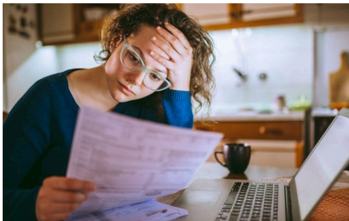
Фото: Уряд перевірить масові платіжки за тепло в Києві