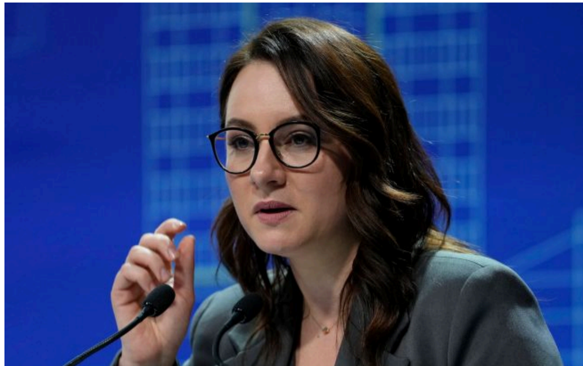
Фото: прем'єр-міністр України Юлія Свиріденко