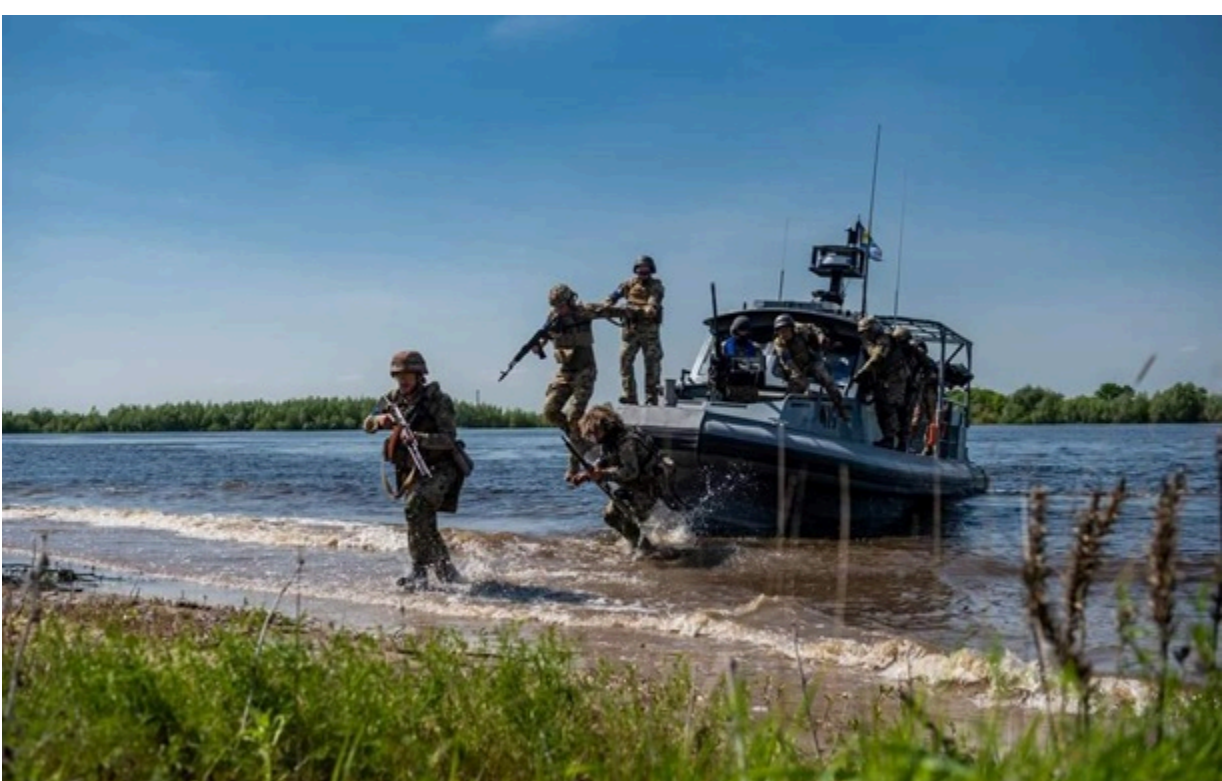
Українські військові отримуватимуть більше грошей

Мова йде про великі гроші і в уряді зараз обраховують, яким чином збалансувати бюджет, зазначила Юлія Свириденко.