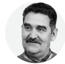
Автор колонки: Ігор Семиволос

Для Тегерана будь-яка поступка під прямим військовим чи економічним тиском США є неприпустимою, оскільки в іранській стратегічній культурі це прирівнюється до капітуляції та втрати режимом внутрішньої легітимності.