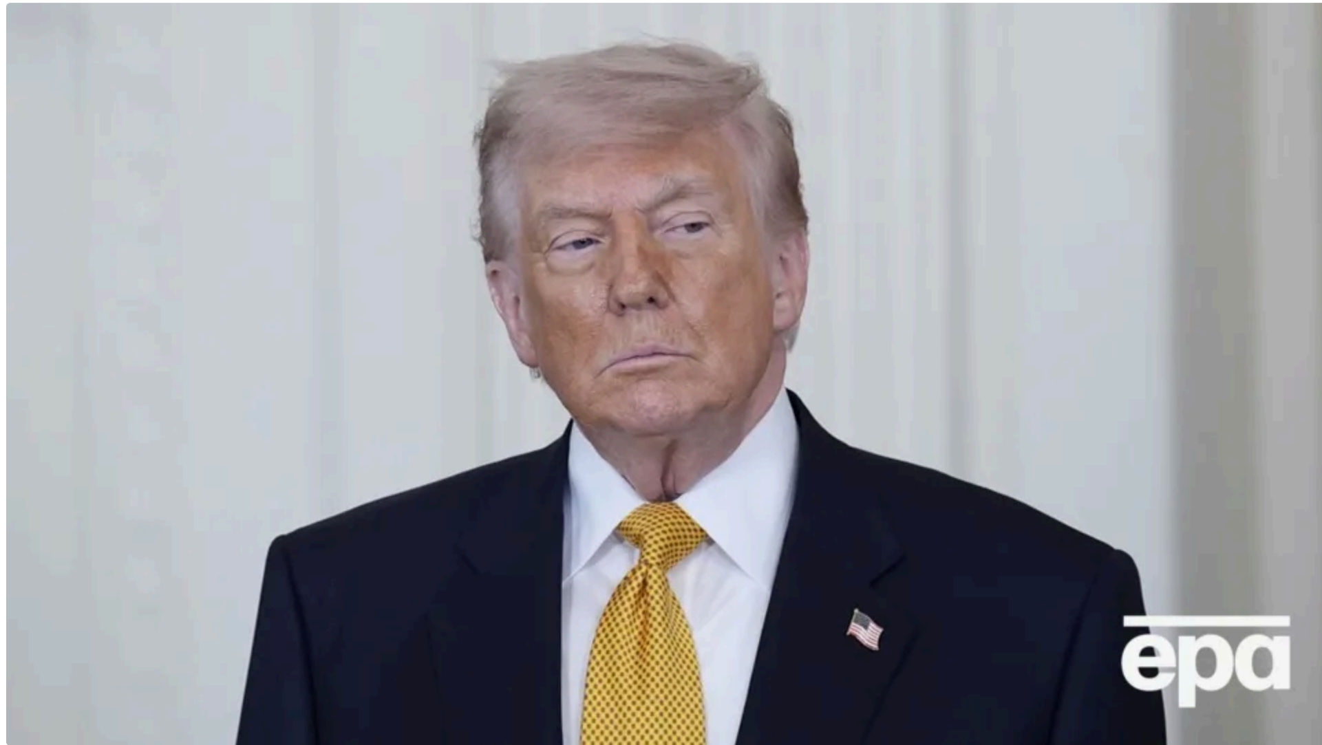
Трамп ще не фіналізував з Іраном потенційну мирну угоду

12 червня, 09:38 🗨️ Этот материал также можно прочитать на русском