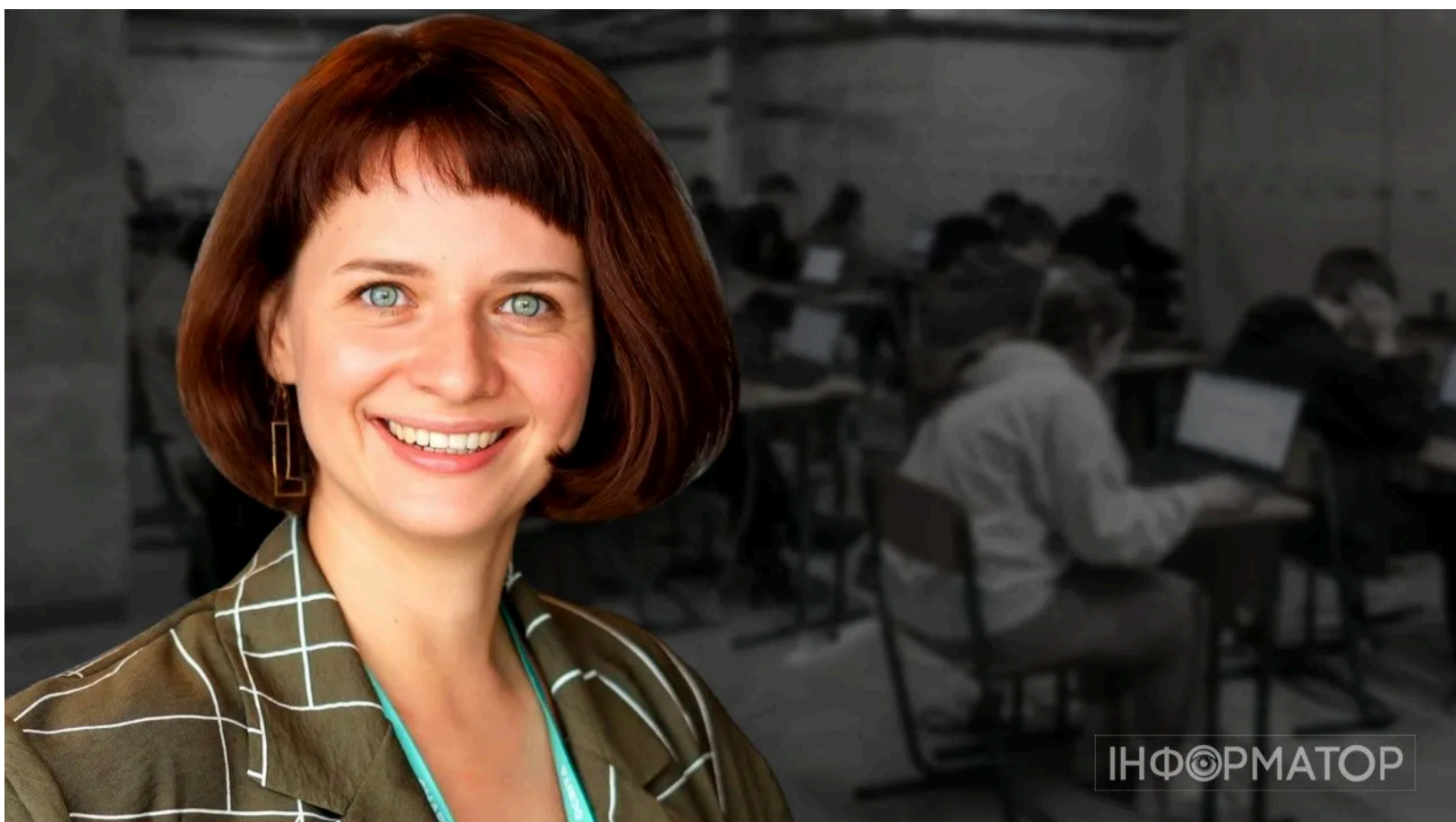
Скандал навколо директорки УЦОЯО Тетяни Вакуленко продовжується.

Скандал навколо директорки Українського центру оцінювання якості освіти Тетяни Вакуленко вийшов на новий рівень. Спочатку з'явилися аудіозаписи з її нецензурною лайкою. Потім Вакуленко опублікувала допис, у якому заявила, що звертається до поліції через кампанію проти неї. Втім, головне питання так і залишилося без відповіді - чому УЦОЯО відмовив у реєстрації доньці зниклого безвісти мобілізованого військового і чому сама Вакуленко вважає таке рішення правильним.