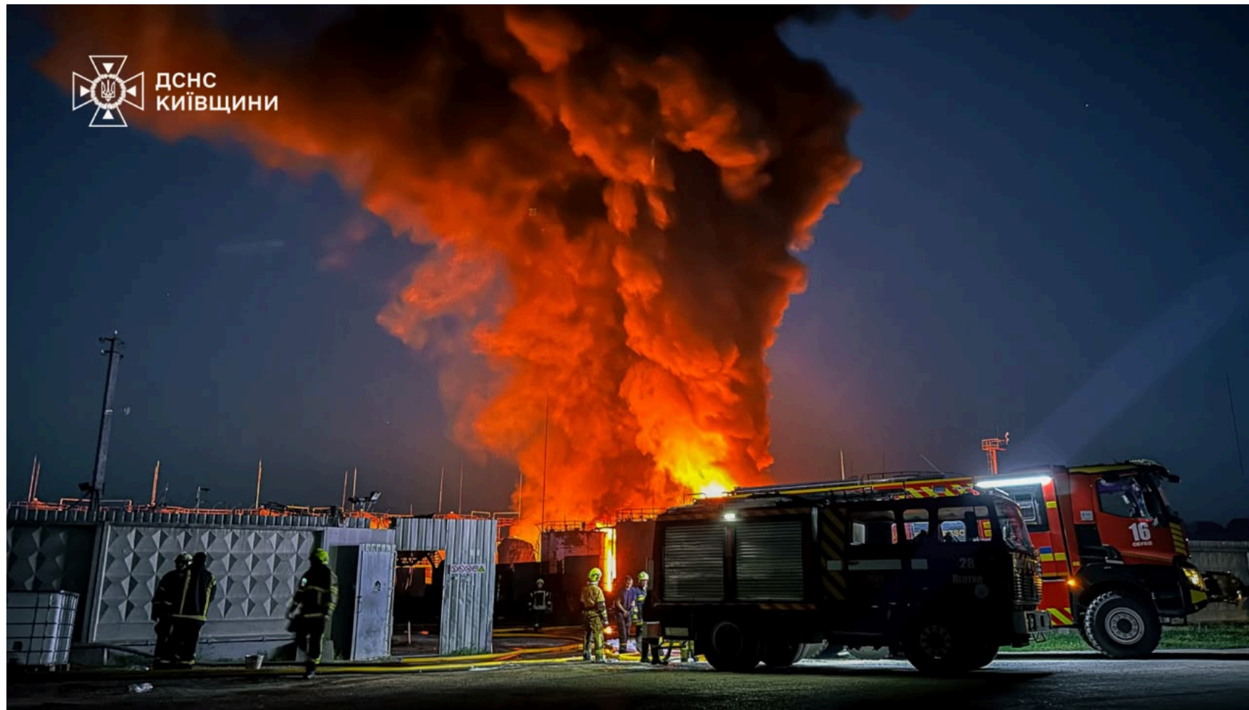
Удар по Київщині 12 червня.

Київщина. У Бориспільському районі Київської області внаслідок атаки російських безпілотників спалахнула масштабна пожежа на об'єкті інфраструктури. Вогонь охопив площу у 2 000 кв.м. До ліквідації залучалися рятувальники Київщини, Києва та спеціальна техніка міжнародного аеропорту «Бориспіль».