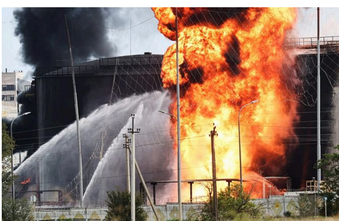
Фото: Україна попросить у союзників ще 20 млрд доларів (Getty Images)