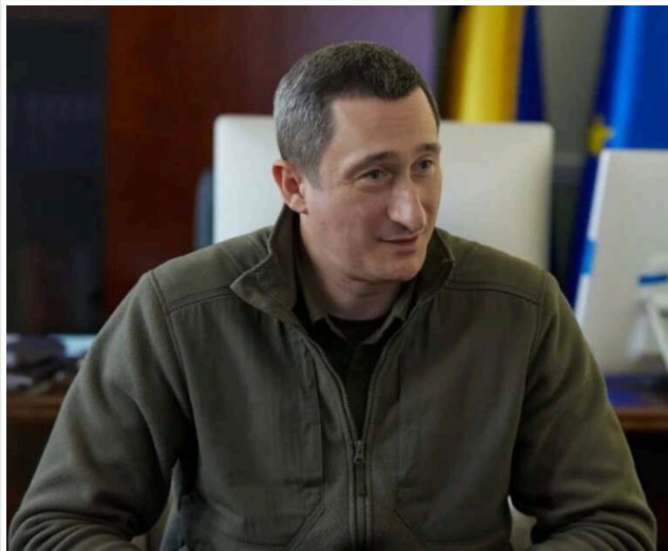
Міністерство національної єдності можуть ліквідувати - після скандалу навколо Чернишова

Міністерство національної єдності, яке очолює віцепрем'єр Олексій Чернишов, можуть ліквідувати.