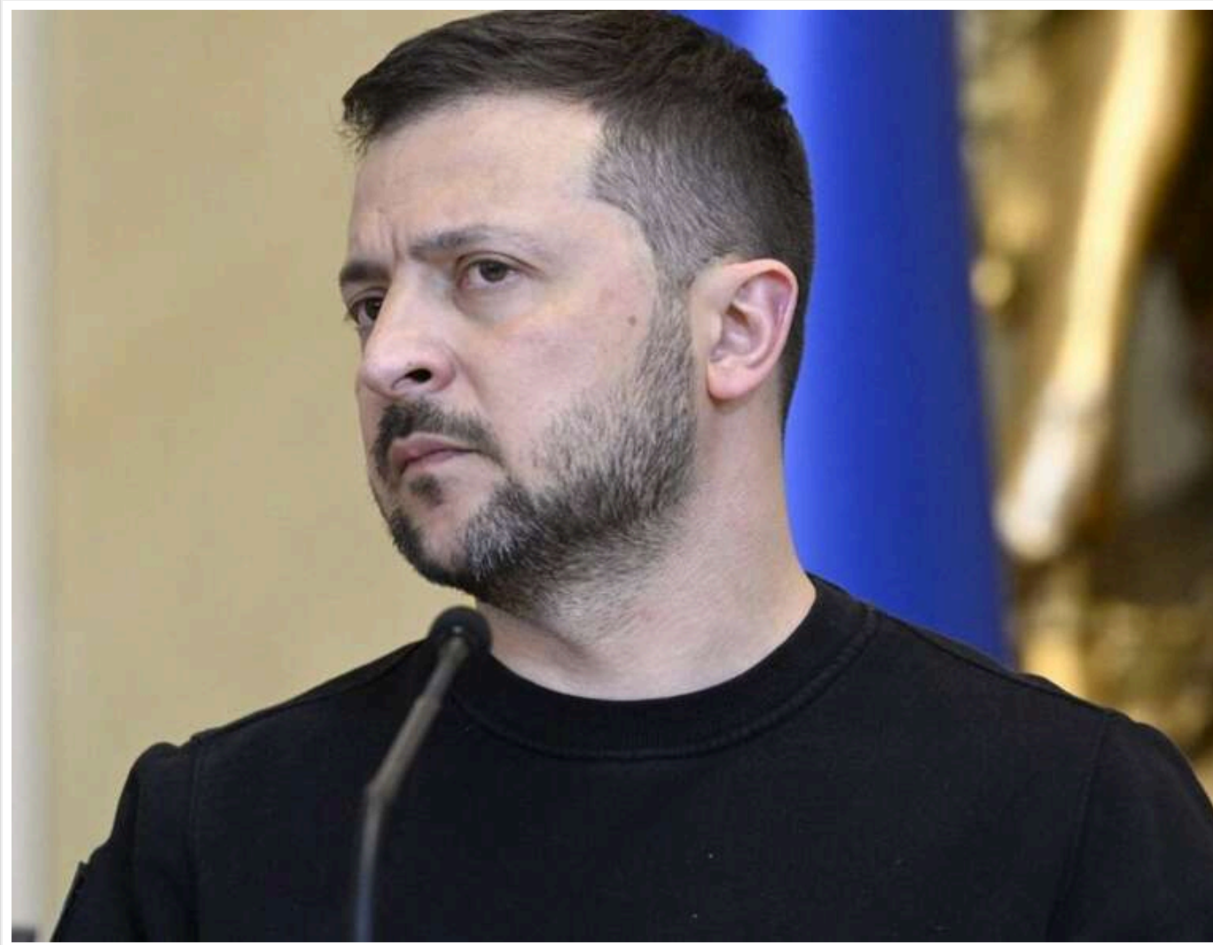
Зеленський розглядає масштабні кадрові перестановки в уряді, - ЗМІ

Читати на руськом Read in English Додати як бажане джерело в Google