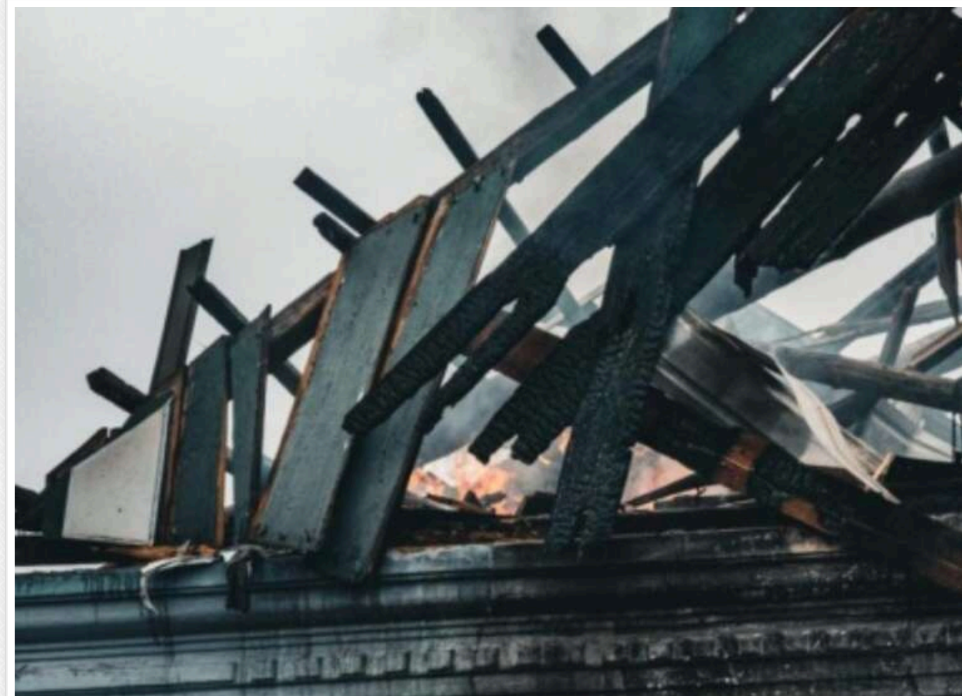
Російські БпЛА знову здійснили атаку на Харківщину: в трьох районах виникли пожежі, є постраждалі

Читати на руськом Read in English Додати як бажане джерело в Google