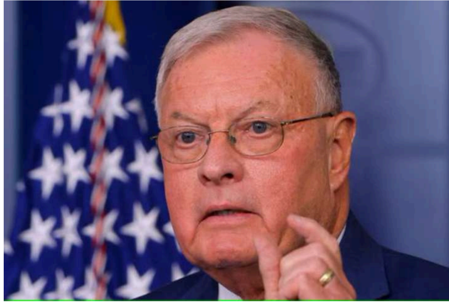
Кіт Келлог

Колишній спецпосланець президента США з питань України Кіт Келлог заявив, що переговори між Україною, США та Росією фактично призупинені. Водночас він назвав це позитивним моментом. Про це Келлог сказав у коментарі «Суспільному».