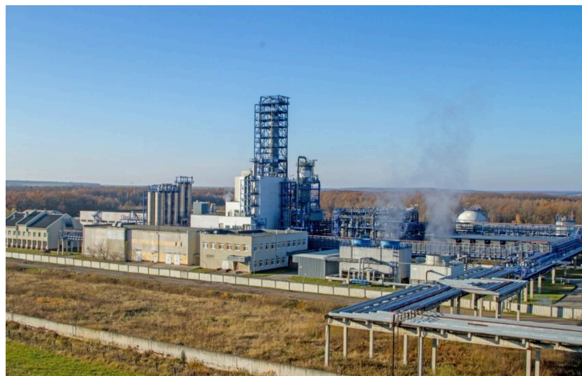
Працівники "Карпатнафтохіму" повернулися до роботи після виплати заборгованої зарплати

У Калуші Івано-Франківської області працівники ТОВ "Карпатнафтохім", щодо якого порушено справу про банкрутство, повернулися на роботу після страйку через борги по зарплаті. Місцева влада скерувала на їх погашення ще 500 тис. грн.