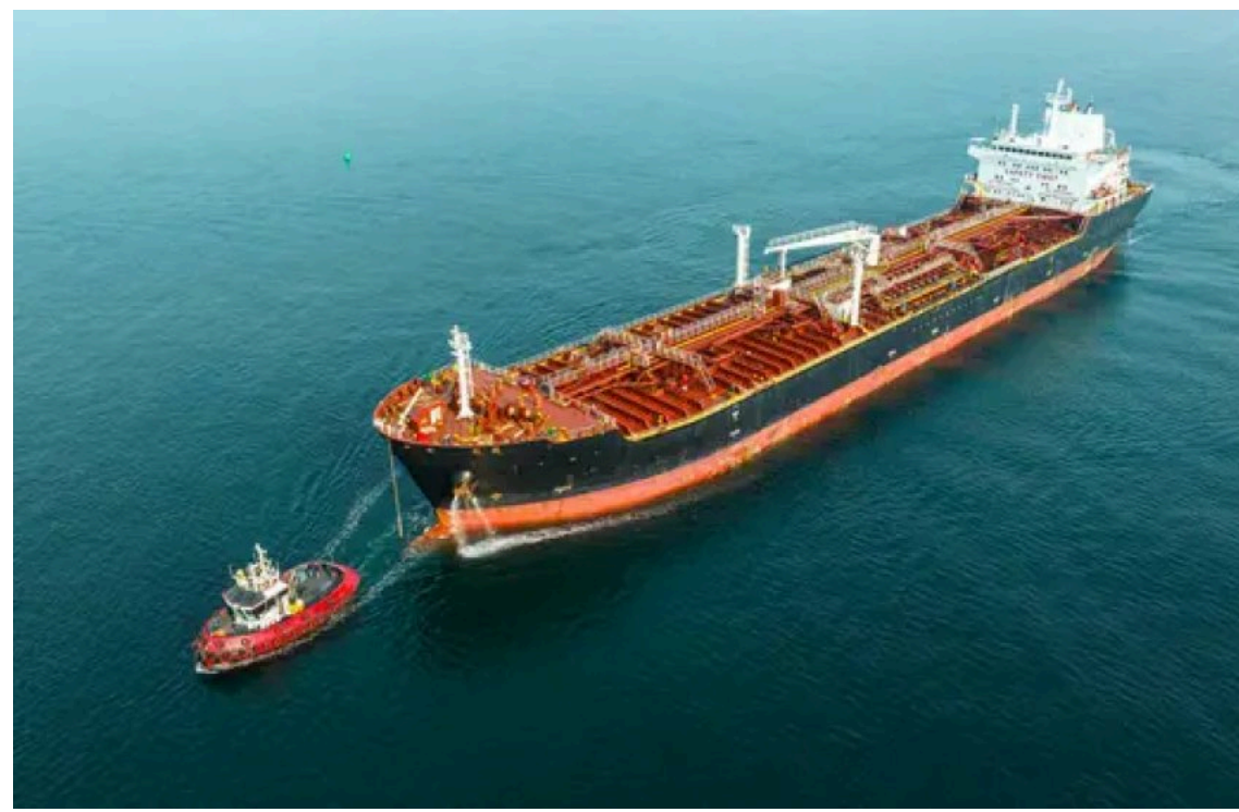
Ціна нафти на 12 червня

У п'ятницю, 12 червня, світові ціни на нафту знизилися більш ніж на 1 долар за барель. Ринок продовжує падати після заяви президента США Дональда Трампа, який скасував заплановані військові удари по Ірану.