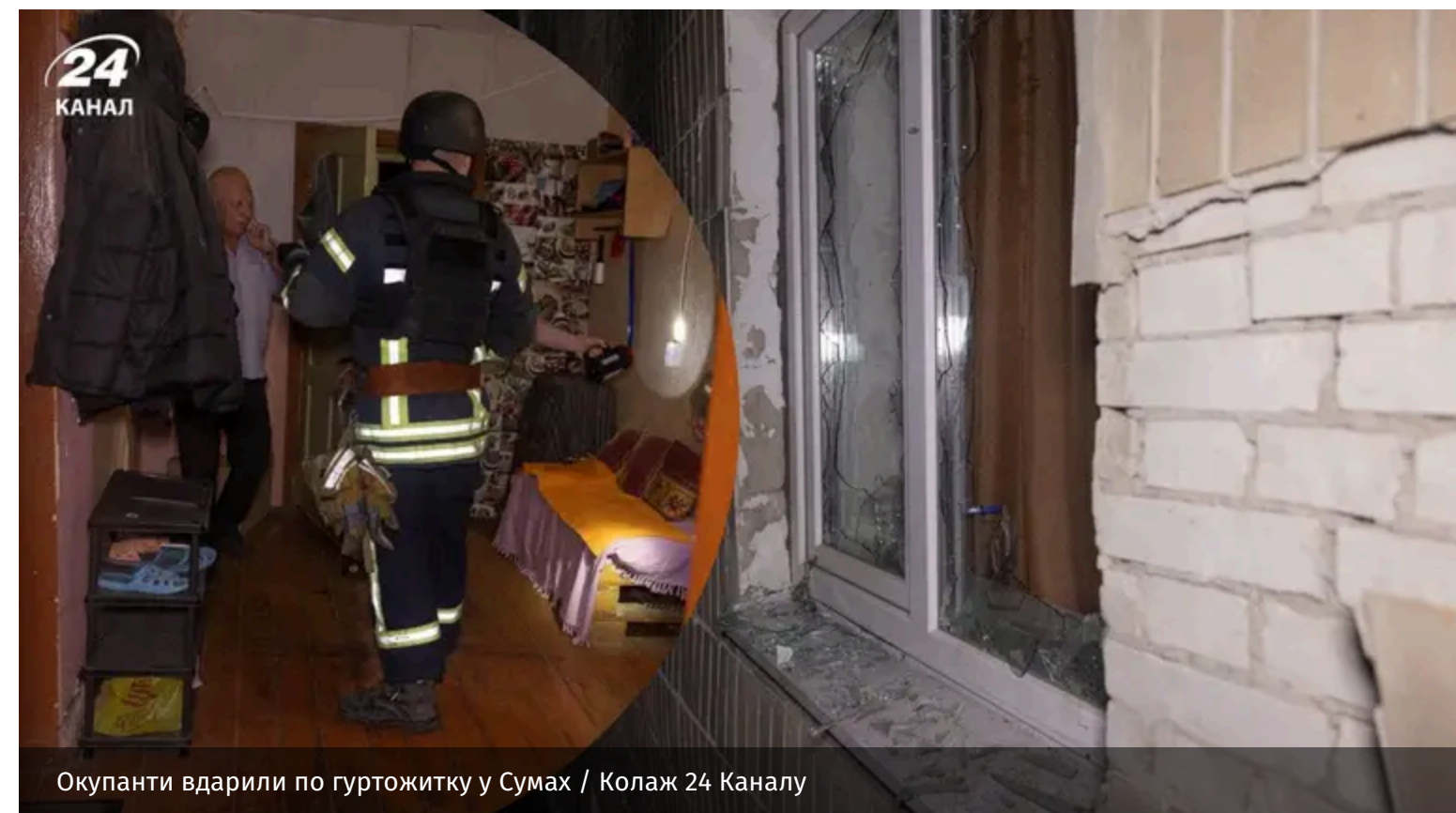
Окупанти вдарили по гуртожитку у Сумах

Уночі росіяни атакували Суми дронами. У місті чули вибухи.