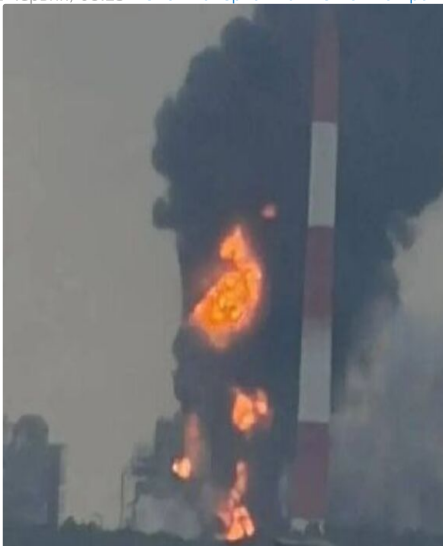
Дрони атакували завод "Нижнекамскнефтехим" у Татарст

12 червня, 08.25 Этот материал также можно прочи